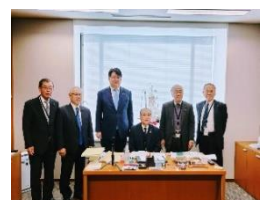
長崎県国境離島の議長の皆さんからの要望活動 11 月