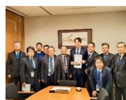
南島原市要望活動 1 月