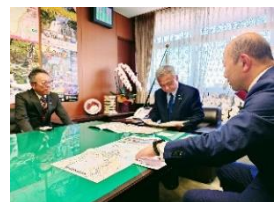
国道 34 号道路整備促進の長崎市要望活動 12 月