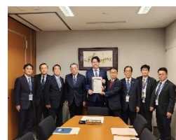
島原半島の皆さんの要望活動 11 月