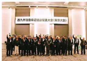
西九州自動車道建設促進大会 (東京大会) 11 月