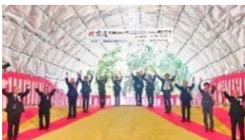
西九州道貫通式西九州自動車道 松浦佐々道路江迎 3 号トンネル貫通式 12 月