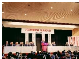
「バス危機突破総決起大会」 11 月