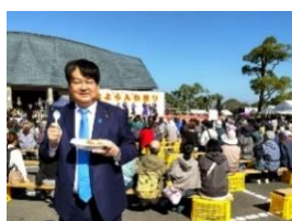
諫早市「森山よらんね祭り」 11 月