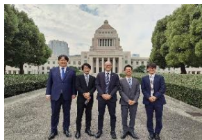
全国農協青年組織協議会からの要望活動 11 月