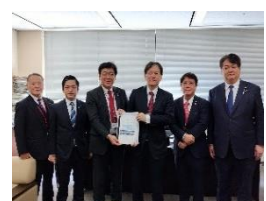
平戸市特別交付税要望活動 1 月