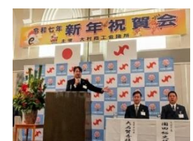
大村商工会議所新年祝賀会 1 月