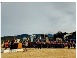
雲仙市消防出初式 12 月