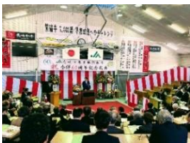
第 38 回 JA 杵岐市農業まつり農協合併 60 周年記念式典 11 月