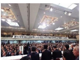
安全・安心道づくりを求める全国大会 11 月