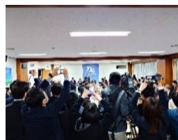
自由民主党税制調査会小委員会 12 月