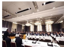
九州地方国道整備促進総決起大会 11 月