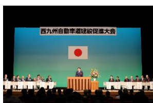
西九州自動車道建設促進大会 (平戸市) 1 月