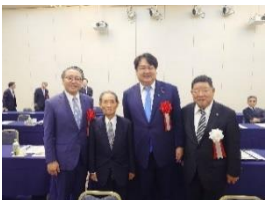
長崎県町村会創立 100 周年記念式典 11 月