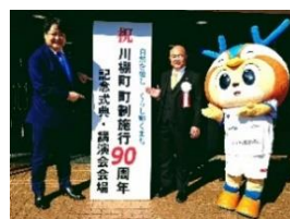
川棚町町制施行 90 周年記念式典 11 月