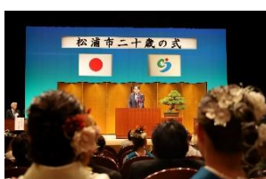
松浦市二十歳の式 1 月