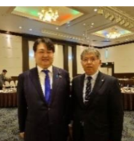
恩師との再会 1 月