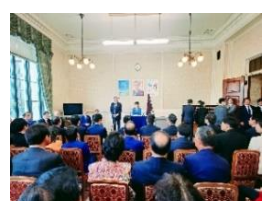
特別国会 11 月