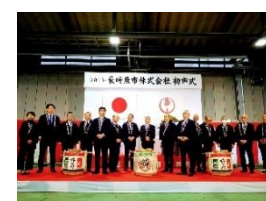
令和 7 年長崎魚市株式会社「初市式」 1 月