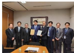
長崎県町村会・離島振興協議会・過疎地域協議会・市町村総合事務組合からの要望活動 10 月