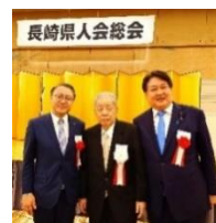
長崎県人会総会 12 月