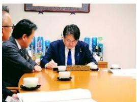
諫早市特別交付税要望活動 1 月