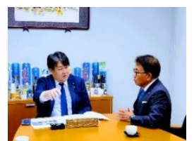
島原市特別交付税要望活動 1 月