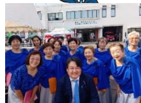
第 24 回茂木地区ふれあいまつり 11 月