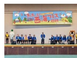
ぎゅぎゅつと西海フェス 2024 11 月