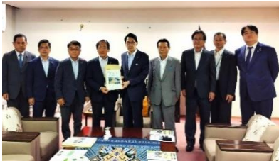
長崎県町村会要望活動 7月