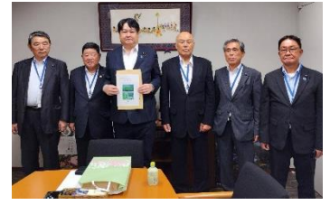
西九州自動車道整備促進要望活動 8月