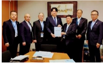
長崎県町村会要望活動 7月