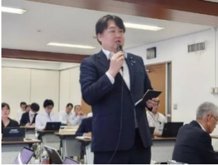
自由民主党「水産部会・水産総合調査会 合同会議」にて質疑 7月