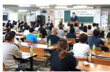
長崎県看護連盟盟南地区支部合同報告会にて 国政報告会 7月