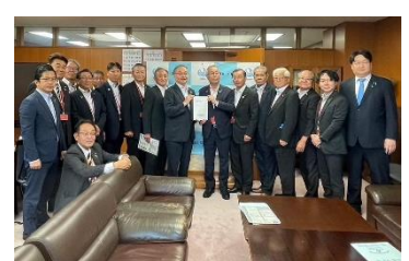
西海市・西海市議会・自民党西海 支部要望活動 7月