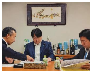
時津町要望活動 7月