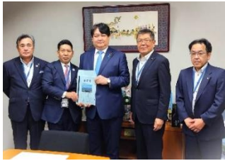
大村市会要望活動 7月