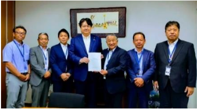
長崎県農業法人協会の皆さんと意見交換 6月