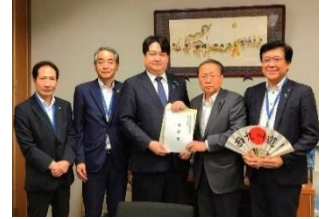
高速道路建設要望活動 7月